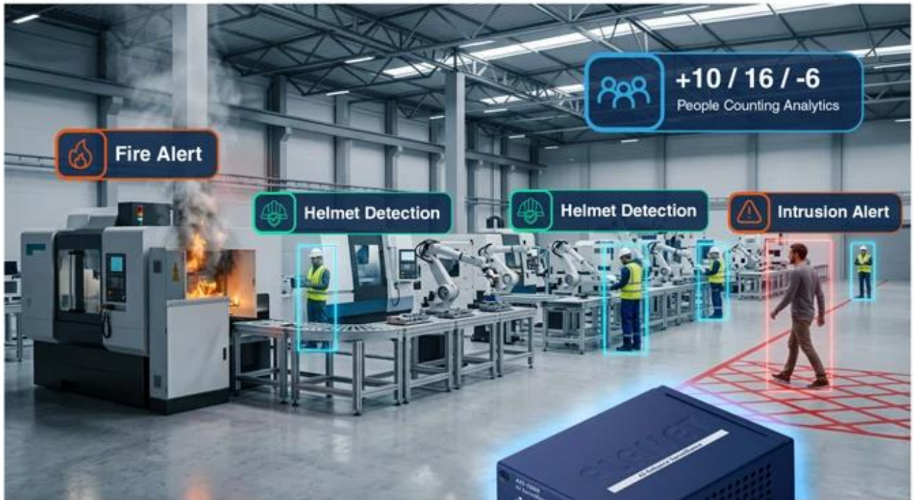
AI Surveillance Station AIS-1000