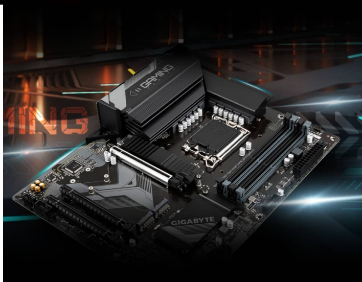
GIGABYTE B760 GAMING X DDR4