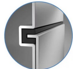
Sealed Lock-and-Key Design

Na zadní straně je k dispozici celá řada portů, mezi nimiž vyčnívá především rozhraní HDMI 2.0 , které zajistí snadné promítání 4K obsahu při vyšším jasu a kontrastu oproti standardnímu rozlišení. Jas je klíčem k viditelnosti. I proto nabízí projektor BenQ LU9245 funkci dynamického tlumení jasu dle scény a optimalizuje světelný výkon a kontrast pro co nejlepší obraz.