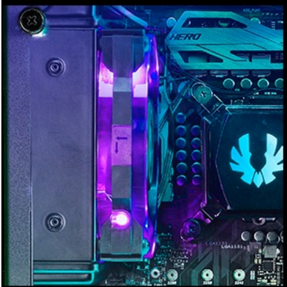
120mm ( radiator )