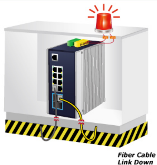
Fiber Cable Link Down