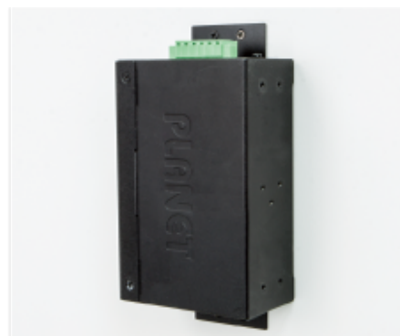
Side Wall Mounting (Space saving)